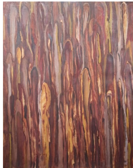
Catarsis Óleo sobre papel kraft 78 x 62 cm 2000