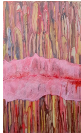
Catarsis Óleo sobre papel kraft 71 x 45 cm 2002