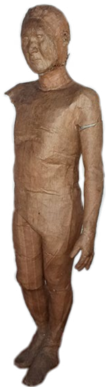
Juan B Papel kraft Escala 1:1 1980