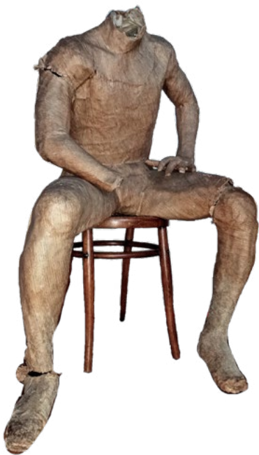
Juan Luis Papel kraft Escala 1:1 1983