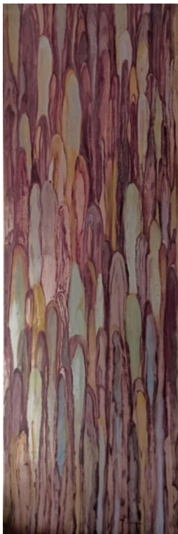
Catarsis Óleo sobre papel kraft 183 x 63 cm 2000