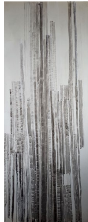
Estados Meditativos Tinta china sobre papel 147 x 60 cm 2022