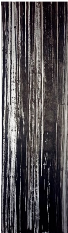
Estados Meditativos Tinta china sobre papel 147 x 43 cm 2022