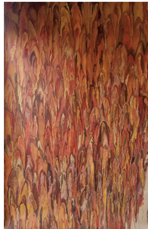
Catarsis Óleo sobre papel kraft 190 x 125 cm 2000