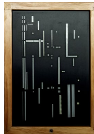
Estados Meditativos Corte laser en acrílico, caja de luz, sensor 52 x 37 cm 2019