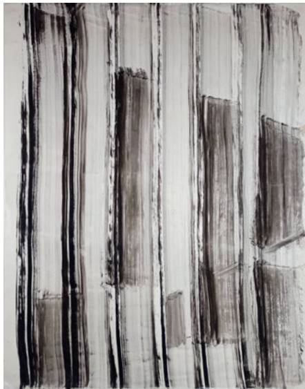
Estados Meditativos Tinta china sobre papel 74 x 58 cm 2021