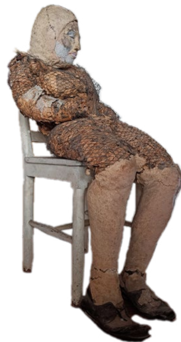
Rosaura Papel maché Escala 1:1 1972