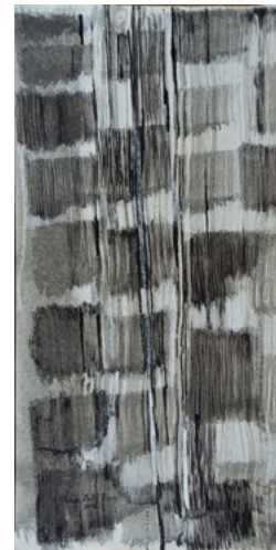
Estados Meditativos Tinta china sobre papel 40 x 20 cm 2022