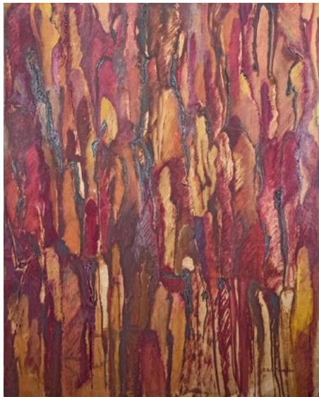
Catarsis Óleo sobre papel kraft 77 x 62 cm 2001