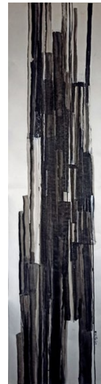
Estados Meditativos Tinta china sobre papel 145 x 37.5 cm 2022