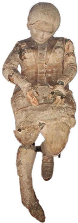
Rosa María Papel maché Escala 1:1 1971