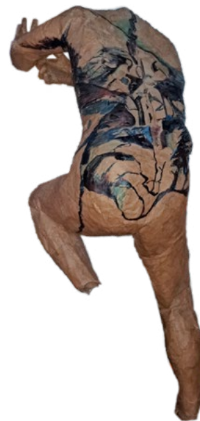
Juan Roberto Papel kraft Escala 1:1 1981