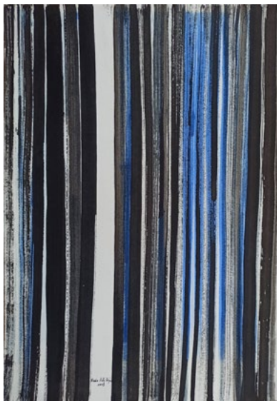
Estados Meditativos 50 x 35 cm Tinta china sobre papel 2021