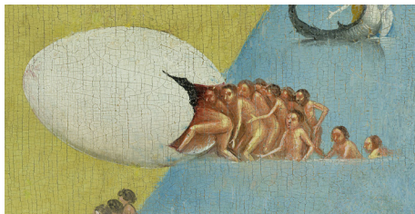
Hieronymus Bosch, El Jardín de las delicias . (Detalle)

El proceso experimental del inicio de su vida como artista la llevó a encontrar la figura del huevo, uno de los leitmotiv recurrentes en su obra. A principios de la década de 2000, Marmorek produjo una serie de Huevos Cósmicos : esferas blancas que ocultaban imágenes y artefactos de deseo dentro de ellas. Una vez que entra en diálogo con el Jardín , y por pura casualidad, encuentra la presencia de dos huevos en el panel central. Uno de ellos está entero y se balancea delicadamente sobre la espalda de una figura en cuclillas, en peligro inminente de caerse y romperse.