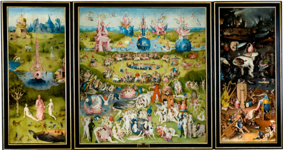
Hieronymus Bosch, 1500-1505, El Jardín de las delicias.*

Hieronymus Bosch, le permitió abrir un diálogo con los habitantes de la pintura, hacerles preguntas sobre la naturaleza del amor e inventar un inagotable conjunto de respuestas posibles.