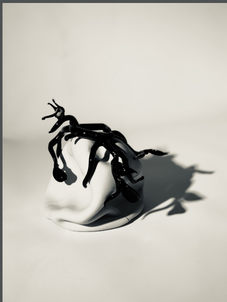
Cosmogonía Tentaculum Porcelana, vidrio Pieza única 17 x 17 x 18 cm 2021