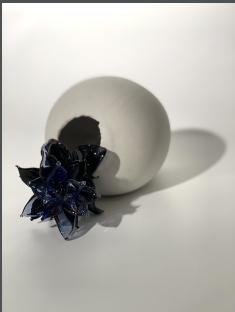
Cosmogonía Deep Blue Flower Porcelana, vidrio 18 x 18 x 25cm 2021