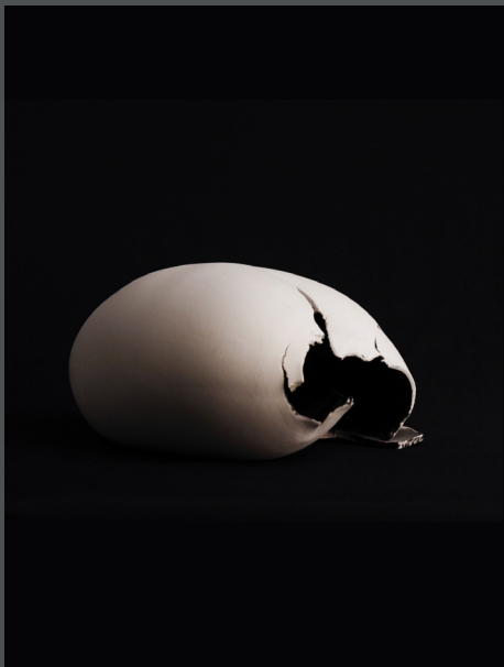
Cada cual video 2:08" 2023