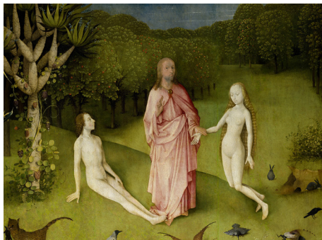
Hieronymus Bosch, El Jardín de las delicias . (Detalle)

yace dentro de ellos es lo que sea que el espectador ponga allí. Estos ya no son huevos, per se , sino Cosmogonías , y la etimología de la palabra revela la intención de Marmorek. Del griego koiné: κοσμογονία (del griego: κόσμος “cosmos, el mundo”) y la raíz de γί (γ) νομαι/γέγονα (“entrar en un nuevo estado de ser”), sus cosmogonías simbolizan el estado desconocido de las cosas cuando se trata de amor, sexo y deseo.