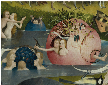
Hieronymus Bosch, El Jardín de las delicias . (Detalle)

Llegar a los huevos de porcelana la llevó a observar la extraña flora del Jardín . En su proceso de investigación encontró que El Bosco se había inspirado en la marginalia : los dibujos que aparecían en las márgenes de las biblias medievales. Y este acto decididamente desobediente de poner lo marginal en el lugar protagónico de la pintura se anuncia como un vaticinio del