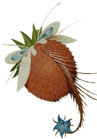
Hieronymus Bosch, El Jardín de las delicias . (Fragmento)