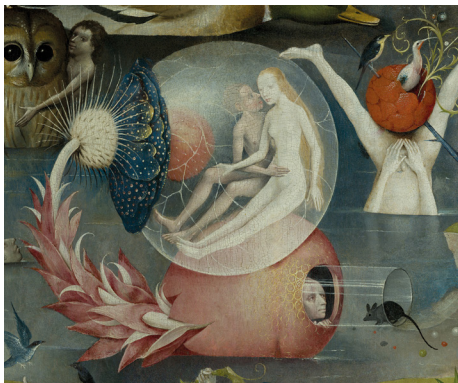
Hieronymus Bosch, El Jardín de las delicias . (Detalle)

Pero el Jardín de El Bosco adquirió el potencial de un leitmotiv en la obra de Marmorek, un ancla que le permitirá volver y revisarlo siempre y cuando todavía haya preguntas sobre el amor y el deseo. Lo que se vuelve fundamental en su relación con el Jardín es el hecho de que la pintura oculte tanto misterio y pueda detonar tantos significados posibles. Y, así, a pesar del encierro (o quizás precisamente gracias a él), Marmorek continuó investigando y revisando las pistas que El Bosco dejó en su famoso tríptico al tiempo que ahondó aún más en su investigación en la naturaleza del amor. De tal manera, durante el encierro, Marmorek creó las piezas que componen La flor que picó la abeja , un gran conjunto de piezas nuevas de las que aquí se exhibe apenas una fracción. El título de esta exposición hace una referencia juguetona a los