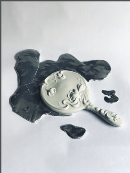
Rendezvous Spillover Porcelana, pintura de cromo 3 x 34.5 x 28 cm 2019