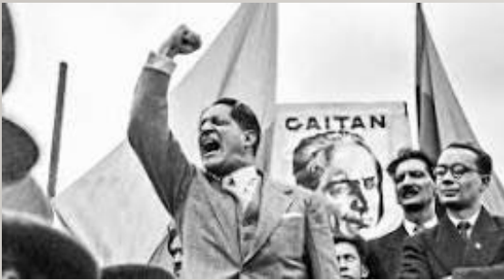
JORGE ELIECER GAITAN