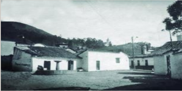
CHORRO DE QUEVEDO