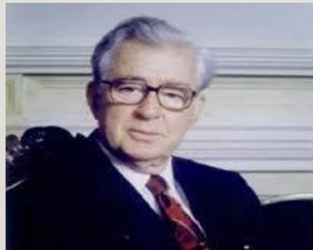
PRESIDENTE Y ALCALDE VIRGILIO BARCO