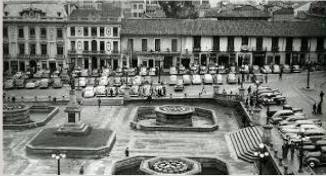
PLAZA DE BOLIVAR