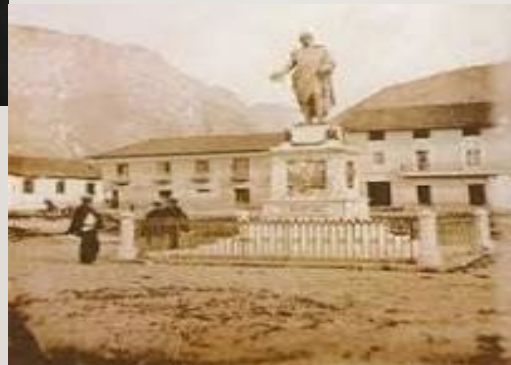
PARQUE SANTANDER BOGOTÁ